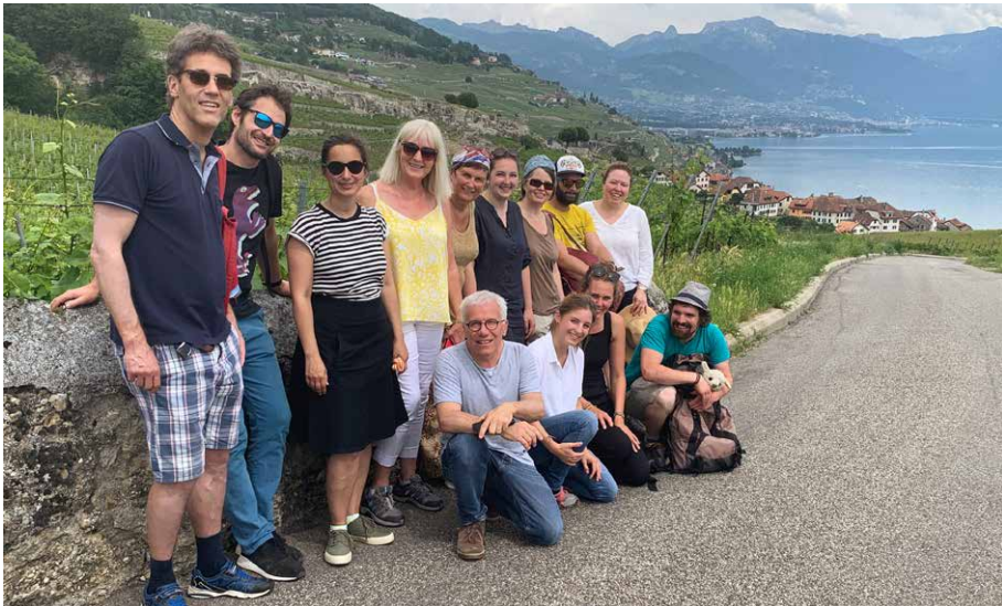
Ausflug von Science et Cité Deutschschweiz, Romandie und Tessin, Lavaux, Juni 2019